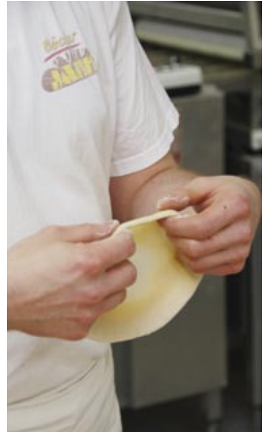
Wie zu Omas Zeiten: In Handarbeit wird aus dem Teig ein Küchle gezogen.