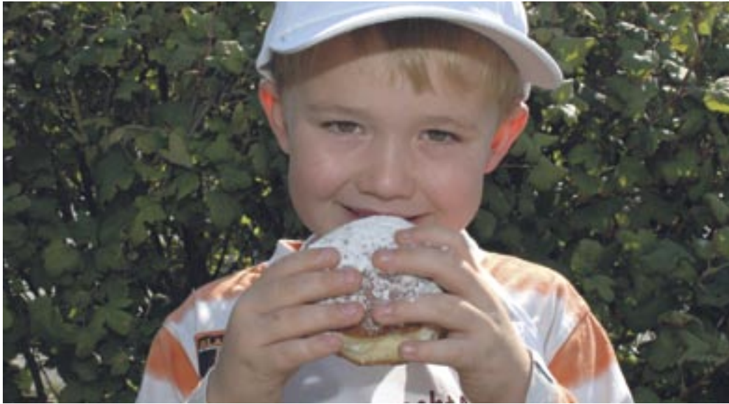
Purer Genuss: Ein herzhafter Biss in den leckeren Krapfen

Im bayerischen Fasching hat vor allem ein leckeres Gebäck Hochkonjunktur: der Krapfen. Eine große Fülle von Krapfen-Variationen gibt es in der „fünften Jahreszeit“, wenn Närrinnen und Narren die Straßen bevölkern. Eine ebenso köstliche wie zum Reinbeißen verführende Riesenauswahl an Faschingskrapfen finden Sie jetzt in allen Filialen vom Bäcker Jann. Erleben Sie den Fasching mit Bäcker Jann und seinen närrischen Köstlichkeiten!