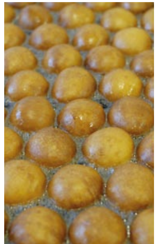
Keine Krapfen – aber genauso lecker: unsere Quarkbällchen