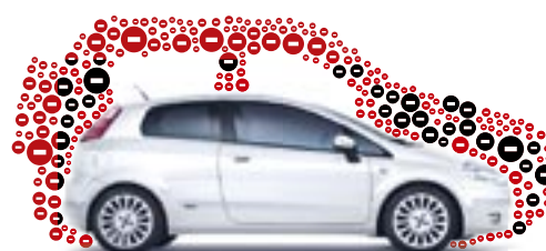
Abb. enthält Sonderausstattung.

Die von Fiat entwickelte eco:Drive™-Technologie analysiert Ihre Fahrweise und hilft Ihnen so, den CO 2 -Ausstoß und Ihren Verbrauch um bis zu 15 % zu senken.