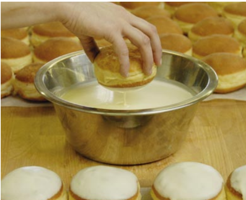
Nach ihrer Füllung werden die frischen Krapfen in eine Zuckerguss-Glasur getaucht.

All diese Vielfalt wird von den Faschingsnarren natürlich in vollen Zügen genossen. Am Unsinnigen Donnerstag vertreiben die Jann-Filialen rund 9000 Krapfen und etwa 500 Küchle. Am Faschingsmontag erhöhen sich diese Verkaufszahlen noch einmal, so dass bis zu 10.000 Krapfen und 600 Küchle verkauft werden.